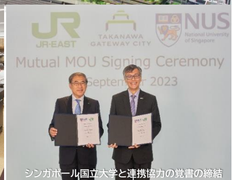
シンガポール国立大学と連携協力の覚書の締結