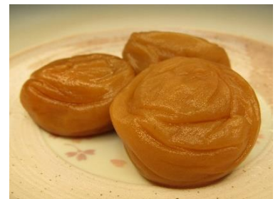
【紀州梅干し(和歌山県みなべ町)】