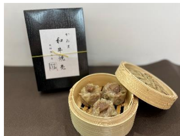
【かめま和牛焼売(栃木県鹿沼市)】