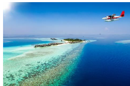
【モルディブ共和国大使館イメージ】