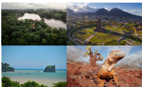
【エクアドル共和国大使館イメージ】

かねてより港区と親交のある大使館が出展し、それぞれの国の魅力を発信します。高輪ゲートウェイ駅から世界に旅してみませんか。ぜひ、各国の展示をご覧ください。