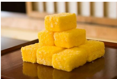
【カストース(長崎県平戸市)】