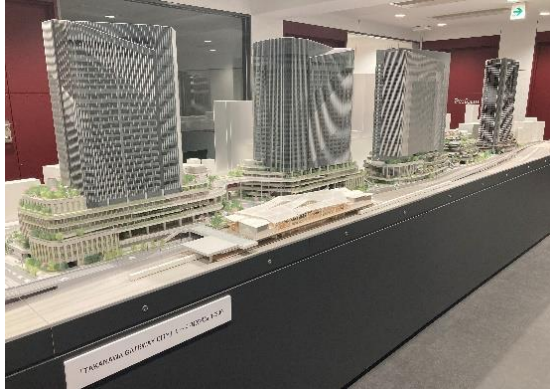
【1/200 模型展示イメージ】

1/200 模型で未来の街の全景をご覧ください。ぜひ街のスケール感をお楽しみください。 さらに、同会場ではこども駅長制服撮影会も実施します。お子さまとぜひご参加ください。