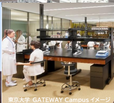
東京大学 GATEWAY Campus イメージ