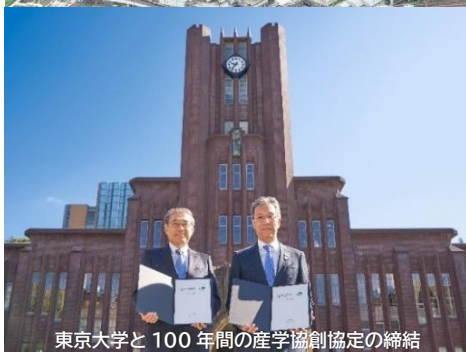
東京大学と100年間の産学協創協定の締結