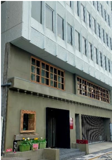
TokyoYard Building 外観

品川開発プロジェクトにおけるまちづくりの拠点として、既存ビルをリノベーションし、2020年4月より活用を開始しました。全フロアにプロジェクトメンバーオフィスや、会議やイベントを行えるスペース等を設け、実証実験、地域との交流、新しいサービスの創出を通じて、TAKANAWA GATEWAY CITYのまちびらきに向けた様々な情報発信を行っています。