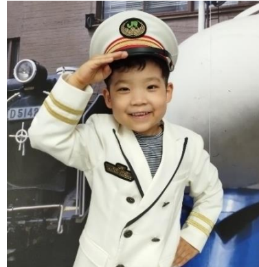
【こども駅長制服着用イメージ】