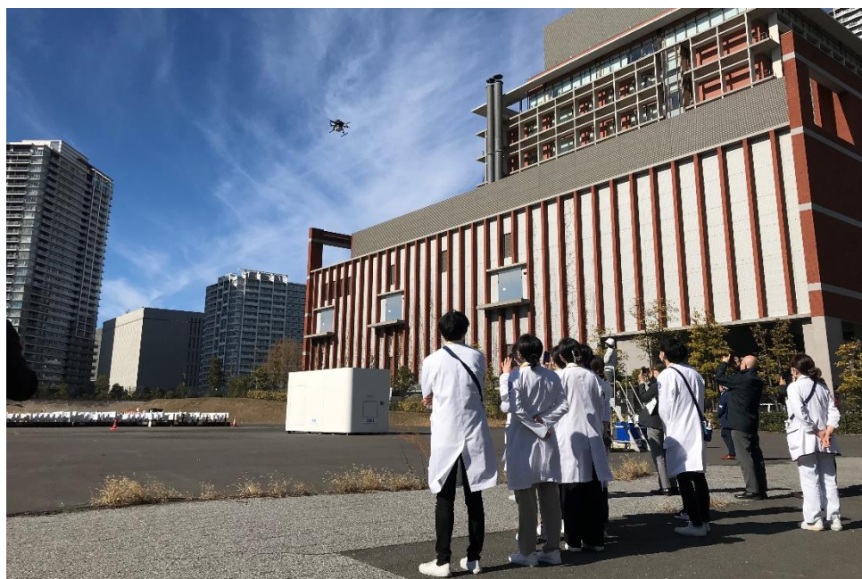
病院関係者の方々に本実証を視察いただいている様子