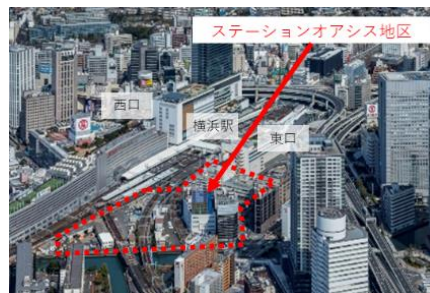
横浜駅東口 ステーションオアシス