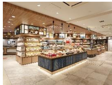
コーナー展開イメージ

また、空き家などを活用した古民家再生を起点とした宿泊事業の展開など新たな地域事業創造などの検討も行っていきます。