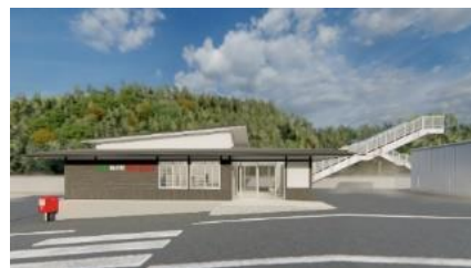
外房線鶴原駅のイメージ

外房線鶴原駅の運営について： https://www.jreast.co.jp/press/2023/chiba/20240221_c01.pdf