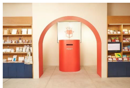
SOZO BOX イメージ

SOZO BOX： https://www.japanpost.jp/pressrelease/jpn/2024/02/20240221_02.pdf