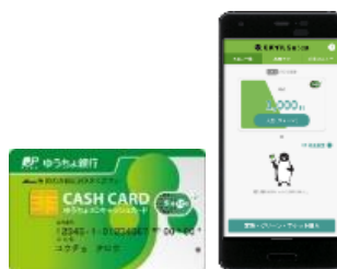
ゆうちょ銀行とモバイル Suica の連携イメージ