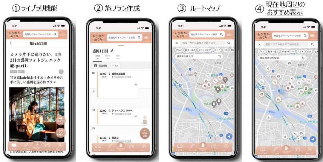
サービスの画像（イメージ）