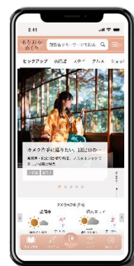
ご提示頂くホーム画面