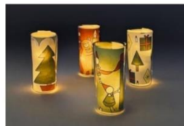
ぬり絵シート・キャンドルの装飾(イメージ)