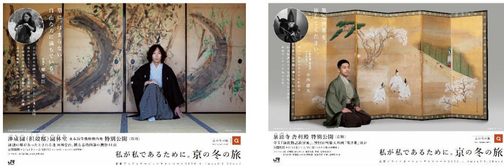
JRグループの主な駅・車内で展開するポスターの一例 ※画像はイメージです

＜京都デスティネーションキャンペーン「第58回京の冬の旅」JRグループポスター＞