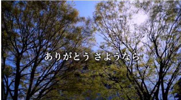
さよなら中野サンプラザクロージングムービー（リンクは以下の通り）

今後も事業者が立ち上げるエリアマネジメント協議会が事務局となり、中野独自の多様な文化と地元の声を活かして、地域の活性化につながる様々な活動を展開し、竣工後は、エリアマネジメント施設と屋上広場の一体的な運用を図り、文化・地域交流を促進することを目指します。