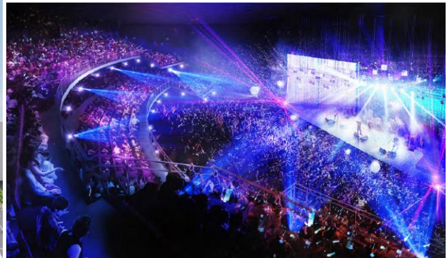
多目的ホールイメージベース (今後変更になる可能性があります)