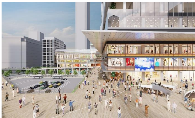
デッキイメージベース (今後変更になる可能性があります)

中野駅から周辺地区へのアクセス動線となる歩行者デッキや、地上と歩行者デッキをつなぐ立体的なアトリウム空間を整備し、中野駅周辺の各地区とバリアフリーでつながる立体的な歩行者ネットワークの形成を図ります。また、建物内の施設と一体的な利用が可能な広場空間の整備により、地域のにぎわいと交流の場を創出するほか、災害時にも避難場所として活用できるよう整備いたします。