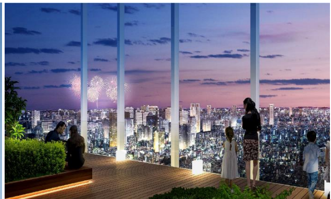
展望施設イメージベース (今後変更になる可能性があります)