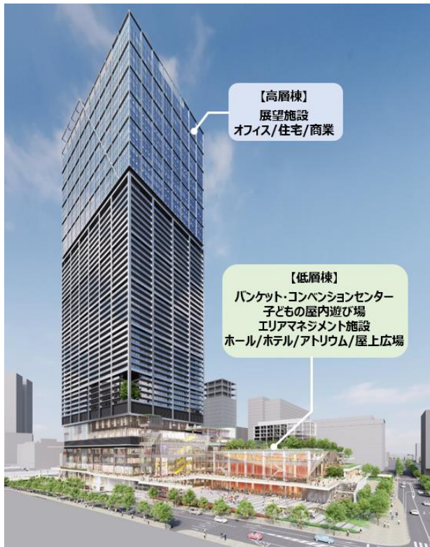
(今後変更になる可能性があります)

中でも交流人口の増加に寄与するための施設として、2023年7月2日に閉館した中野サンプラザのDNAの継承・発展のため、新たな「文化の聖地」として臨場感や一体感が感じられる、最大7,000人規模の「多目的ホール」を整備します。また、中野サンプラザの宴会場や最上階レストランなどが交流の場として様々なシーンを作ってきたことから、ハレの日使いもできる展望レストランや東京西郊、唯一無二の眺望を楽しむことができる屋外テラスを有する「展望施設」、区民や企業などの交流・会合の場として利用できる「バンケット・コンベンションセンター」を導入します。また子育て世代が安心・安全に利用できる「子どもの屋内遊び場」なども整備し、複合型子育て支援機能の導入を図ります。