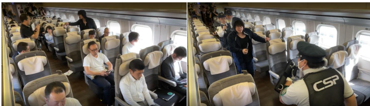
10月3日 東北新幹線（宇都宮～小山間） 異常時対応訓練

乗務員、駅、指令、アテンダントなどの JR 東日本グループ社員に加え、警察や警備会社の協力を頂きながら、新幹線などの実車両を用いた異常時対応訓練を定期的実施しています。警察と連携した実践的な内容とすることで、課題の抽出および社員一人ひとりの異常時対応能力の向上を図っています。また、全ての乗務員に対して、異常時の対応フローを教育しています。