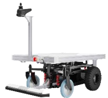
AGV（無人搬送車） 協力：協栄産業(株)