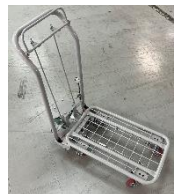
客室輸送専用台車

1 回目の新青森の新幹線車両基地でのトライアルでも検証した AGV を活用することで、人手不足を考慮した省力化を図ります。