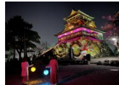
丸岡城プロジェクトマッピングナイト「ヒカリ結び」