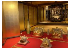
加賀伝統工芸村 ゆのくにの森「黄金の間」