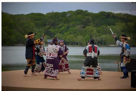
ウポポイ(民族共生象徴空間)

「TRAIN SUITE 四季島」の旅は、全て旅行会社が企画する旅行商品として販売します。旅行商品は、(株)JR東日本びゅうツーリズム&セールスが販売するほか、主な旅行会社(海外の旅行会社を含む)での販売を予定しています。