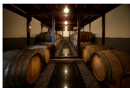
勝沼のワイナリー