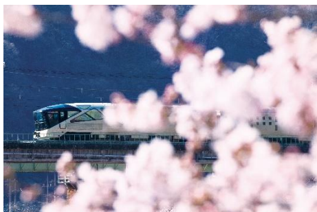
上越線・津久田-岩本 間