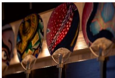
黒石ねぶたうちわ