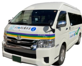
運行車両（通常タイプ）イメージ