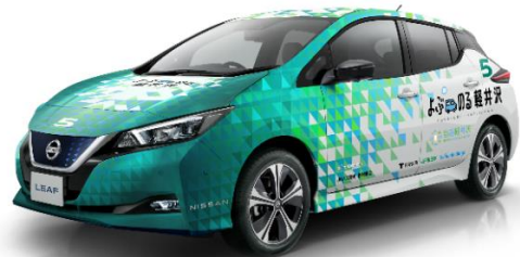
運行車両（電気自動車）イメージ