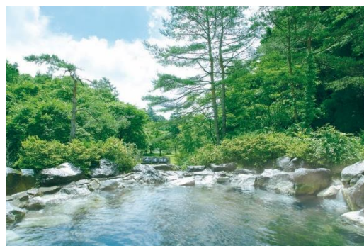
立ち寄りの湯 軽井沢千ヶ滝温泉