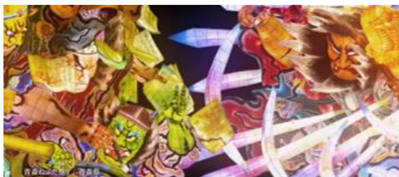
大型LEDで視聴できる青森ねぶた祭りの映像