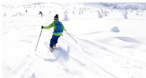
VRで体験できる八甲田山バックカントリーの映像