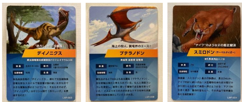
古生物カード（画像は一部）

メインコンテンツである「LOST ANIMAL PLANET」では、スマートフォンやタブレットに「XR City」アプリをダウンロードしていただくことで、XR BASEに限定登場する絶滅した古生物の発掘をARで体験いただくことが可能です。またアプリをダウンロードしてくださったお客さまを対象に恐竜などの古生物カードが必ずもらえるカプセルトイを8月より設置します。 ※2