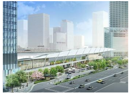
【グランルーフ外観】

「東京駅が街になる」というコンセプトのもと、「東京ステーションシティ」と命名し進める東京駅周辺整備プロジェクトの一環として 2013 年 9 月に完成しました。 Grantウキョウノースタワーと Grantウキョウサウスタワーをつなぐ長さ約 230 m の大屋根と、賑わい空間と歩行者ネットワークを形成するペDESTリアンデッキは、先進性・先端性を象徴する八重洲口のランドマークとなっています。