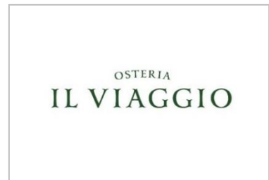
【ショップロゴデザイン】