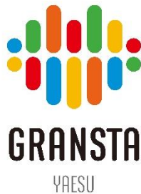
【商業施設ロゴデザイン】

“お客さまにとっての分かりやすさ”という視点に立ち、東京駅構内にて異なる名称で運営してきた複数の商業施設を「グランスタ」ブランドで一本化し、各商業施設の名称を「グランスタ+エリア名」に改定します。「グランスタ」ブランドとしての一体感を創出し、東京駅を中心としたエリア全体の価値向上に寄与します。