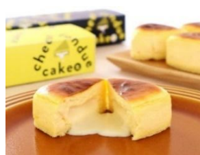
石川県初 『チーズフォンデュケーキ』 テラ・セゾン