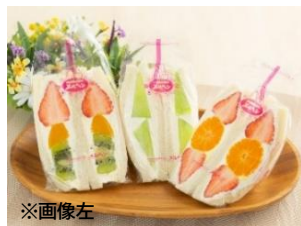
石川県初 『フルーツスペシャル(いちご)』 サンドイッチハウス メルヘン