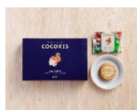
石川県初、東京駅限定 『サンドクッキー ヘーゼルナッツと木苺』 COCORIS