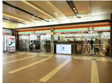
セブン-イレブン ハートイン JR 金沢駅店