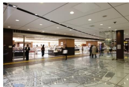
お土産・スイーツエリア