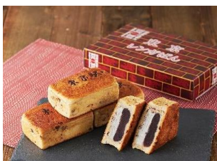
石川県初、東京駅限定 『東京レンガぱん』 東京あんぱん豆一豆