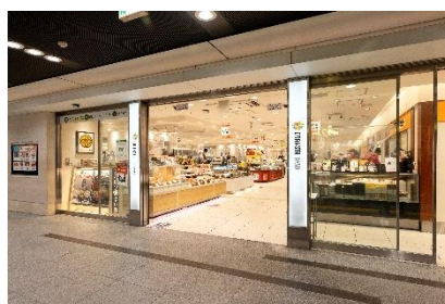
お弁当・惣菜エリア