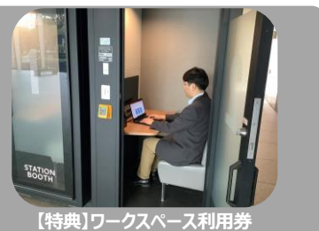
【特典】ワークスペース利用券

※旅行のスタイルに合わせて「列車と宿泊」を自由に組み合わせられる「JR 東日本びゅうダイナミックレールパック」の予約サイトにおいてクーポンを使用してお得にご利用いただけます。ワークスペース利用券は、JR 東日本が展開する「STATION BOOTH」が利用対象となり、会員登録を行うと予約してご利用いただけます。