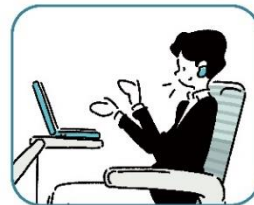
WEB 会議・動画視聴 (イヤホン着用)