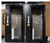
▲ STATION BOOTH