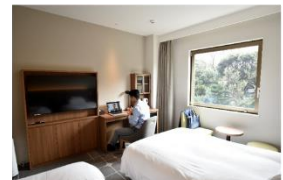
▲ホテルメッツ目白