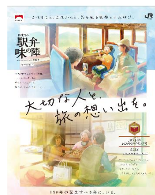
メインビジュアル