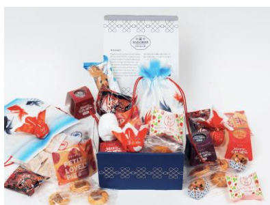
おみやげボックス

毎月テーマに沿って日本各地のお菓子・地産品などの詰合せボックスをお届けします。JR 東日本グループの幅広い取引先ネットワークを活用して、商品選定を行います。また、EC サイトや小冊子を通じて、商品の背景や日本文化をお伝えするとともに商品選定に込めた想いを発信していきます。