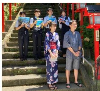
2022年7月シンガポール向けオンラインツアー (千葉運輸区)