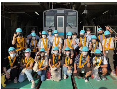
2022年9月交流型ツアー (八戸運輸区)

例：グランスタお買い物特典、東京ステーションホテルで歴史や文化に触れるホテルツアー付き宿泊プラン、ホテルメトロポリタン丸の内で眺望も楽しむ食事プランなど