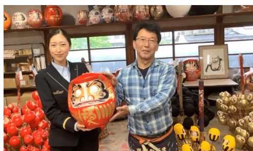
2022年9月シンガポール向けオンラインツアー (新前橋運輸区)