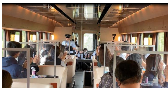
2022年10月交流型ツアー (福島統括センター)