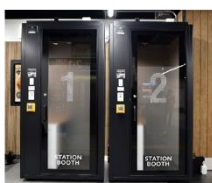
▲ STATION BOOTH