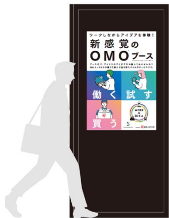
▲BOOTH デザイン(イメージ)