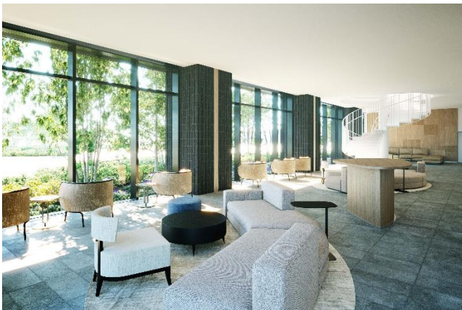
1階 ロビーラウンジ