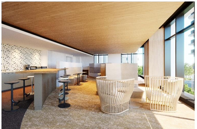
2階 パブリックラウンジ (コワーキングスペース)