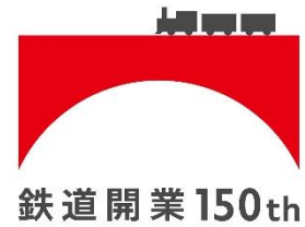
鉄道開業 150 年キャンペーンロゴ

キャンペーン期間：2022 年 4 月 1 日（金）～2023 年 3 月 31 日（金）