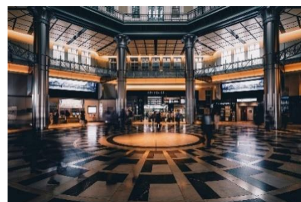
記念撮影スポットの東京駅舎南ドーム