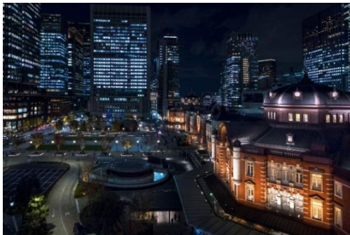
ホテルがある東京駅丸の内駅舎と街並み

世界的なホテル格付けの「フォーブス・トラベルガイド」にて 2021 年含め 6 年連続 4 つ星を獲得、また当ホテルが加盟しているスモール・ラグジュアリー・ホテルズ・オブ・ザ・ワールドの「SLH アワード 2020」で「INVITED Hotel of the Year」を受賞。