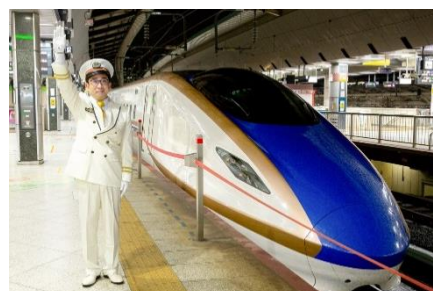
JR東日本の駅長制服（イメージ）

ホテルにチェックインしてレストラン〈ブラン ルージュ〉でのディナー後、深夜よりJR東日本の駅長制服を身にまとい、駅構内や新幹線ホームなど改札内外のフォトスポットでプロカメラマンによる記念撮影を体験いただきます。撮影した写真はアルバムに製本し、画像データとともに後日ご自宅にお送りします。また、記念品はJR東日本の乗務員が使用するSEIKO製の懐中時計で、鉄道開業150年ロゴとシリアルナンバーが刻印された本プランだけの特別記念品です。