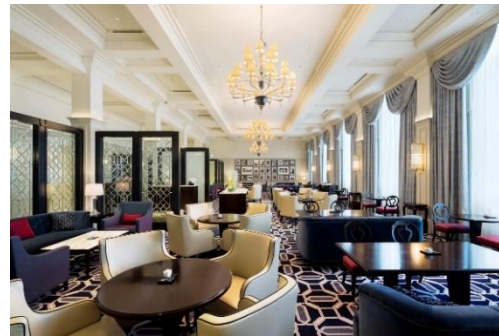
香り豊かなフレイバーティーなどを味わう〈ロビーラウンジ〉

東京ステーションホテル公式 web サイト https://www.tokyostationhotel.jp/