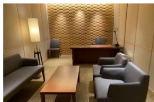
▲STATION DESK 東京 premium 応接室