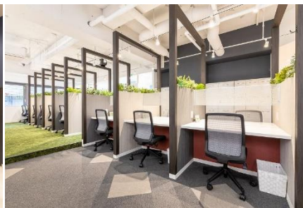
<首都圏・関東エリア> BIZcomfort 池袋西口