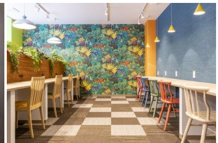
<東海・関西エリア> BIZcomfort 大阪東梅田