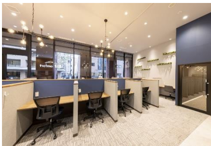
<北海道・東北エリア> BIZcomfort 札幌