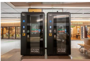
▲ STATION BOOTH仙台(新幹線改札内)