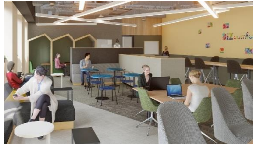
BIZcomfort 千葉西口 イメージ

BIZcomfort 公式サイト： https://bizcomfort.jp/