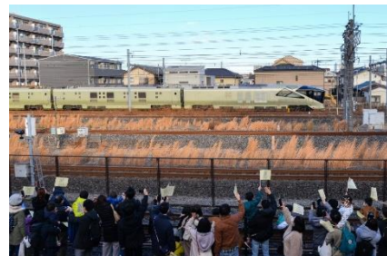
※イベントイメージ