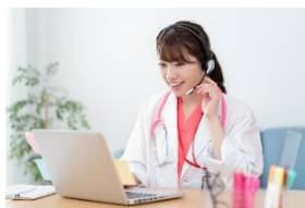
育児中の医師も オンライン診療に参加