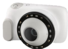
皮膚観察用カメラ CASIO「ターモカメラ/DZ-D100」