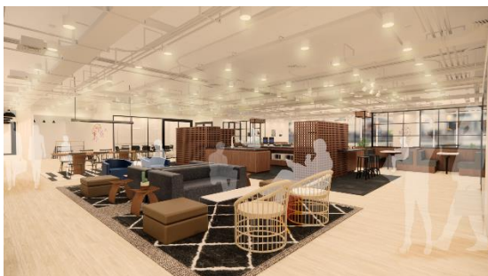
WeWork 日比谷 FORT TOWER イメージ (2021 年 12 月 1 日 OPEN 予定)

「WeWork 日比谷 FORT TOWER」は、日比谷、霞ヶ関、虎ノ門、新橋の結節点となる場所に位置しています。小規模から 100 名以上規模のオフィス設置に柔軟に対応できる高い拡張性が特徴です。「WeWork KABUTO ONE」は、国家戦略特区プロジェクトとして認定されている、兜町・茅場町再開発プロジェクトの第一弾として、新たに茅場町のランドマークタワーとなる「KABUTO ONE」ビル内の 2 フロアに開設します。それぞれ STATION WORK の提携店として、このたび利用が可能となります。