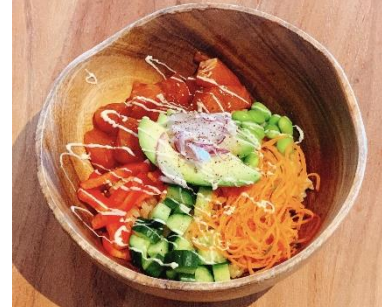
鮭のポキ丼 価格：1,298 円 (税込)