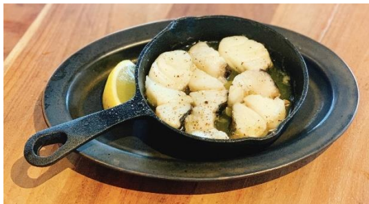
鱈のピルピル (タラのオリーブオイル煮) 価格：748 円 (税込)