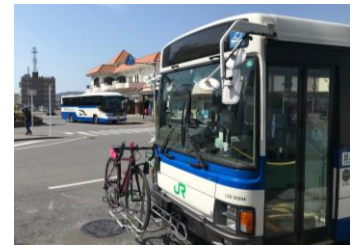
“のってたのしい列車” サイクルトレイン B. B. BASE & B. B. BASE バス