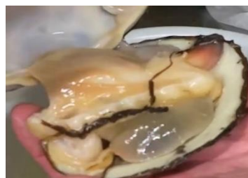
生きたまま届くホッキ貝