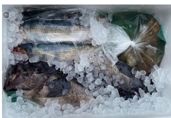
おまかせ函館鮮魚セット