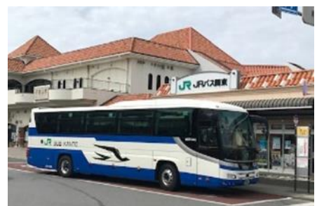
高速バス館山駅到着