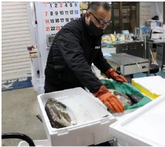
函館の今朝どれ鮮魚を梱包