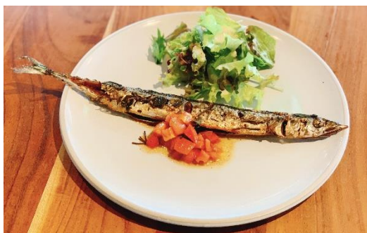
秋刀魚のコンフィ 価格：1,628 円 (税込)