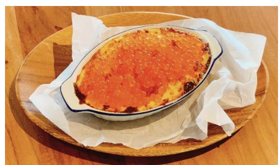
鮭といくらのドリリア 価格：2,398 円 (税込) ※限定 20 食