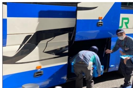
東京駅にて鮮魚載せ替え