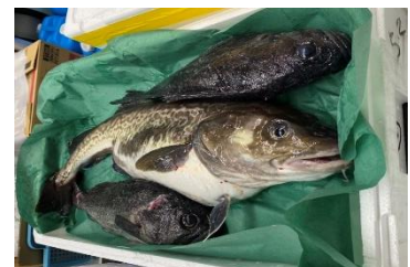
セット外魚種指定