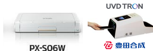
UV-C 高速表面除菌装置