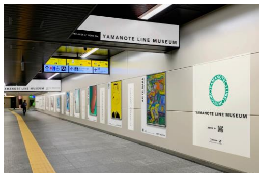
【YAMANOTE LINE MUSEUM イメージ】

気鋭のアート作品を駅の広告フレームで展示します。 日々の暮らしに、新しい世界への入口をつくります。