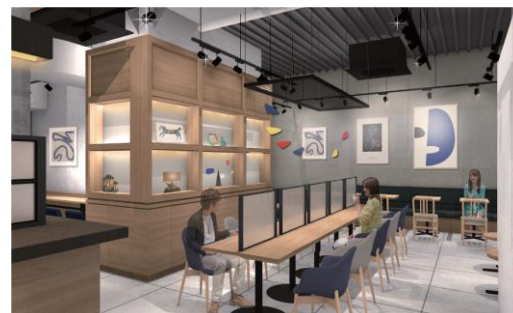
【ToMoRow Gallery イメージ】

■内 容 JR東日本グループが運営する店舗内で初の、 コーヒーショップ併設のアートギャラリーです。 不定期でアーティストの作品が入れ替わり、訪れるごとにアートとの新たな出会いを楽しめるスペースに生まれ変わります。