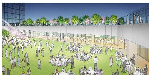
7階屋上庭園に面したレセプション会場