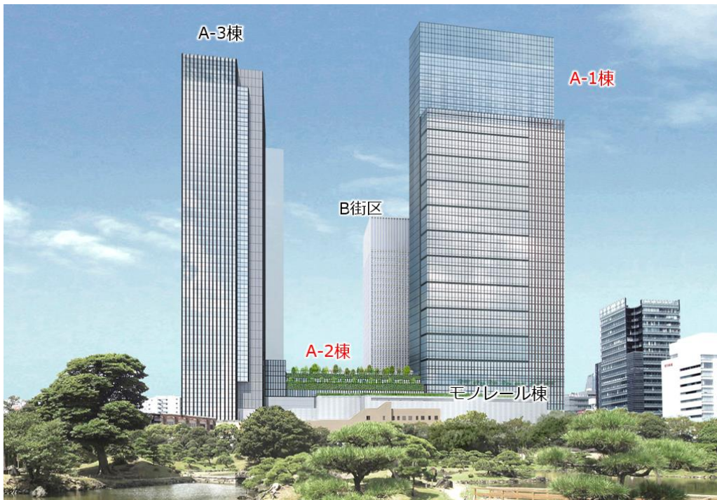
外観イメージ／旧芝離宮恩賜庭園より

具体的には、当初の都市計画提案における整備（交通結節機能の強化、国際交流拠点の形成、交通結節点における防災機能の強化と環境負荷低減）に加え、新たな整備（観光拠点・都心型MICE拠点の形成、防災性向上と環境負荷低減への一層の取組）を行い、陸・海・空の交通結節点である浜松町に相応しい拠点づくりを行ってまいります。