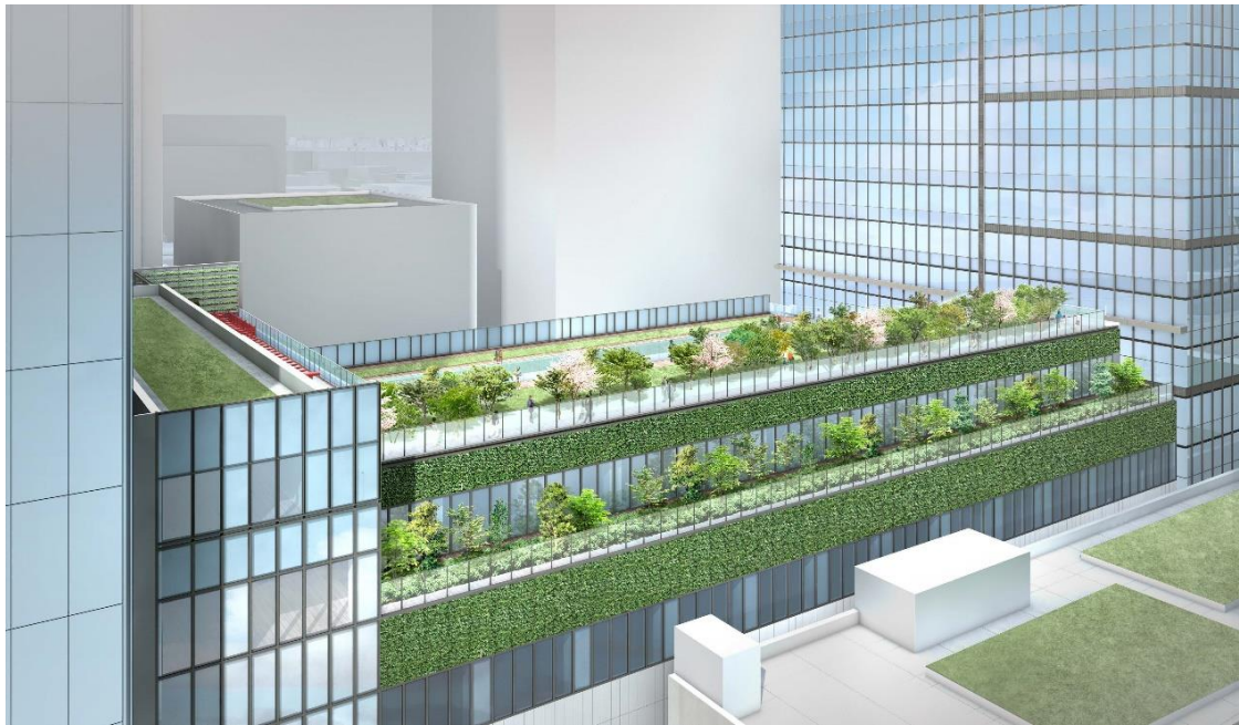
旧芝離宮恩賜庭園と立体的な繋がりを意識した屋上緑化

建物低層部の緑化計画を見直し、旧芝離宮恩賜庭園や隣接街区・大門通り等、周辺環境との緑の連続性を強化します。