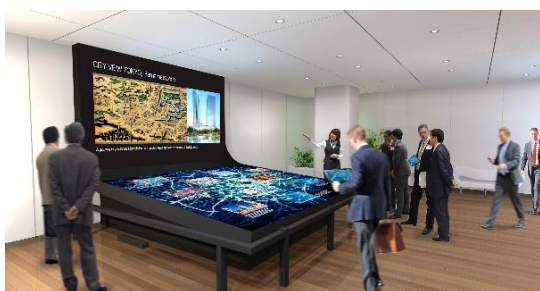
DMO 活動施設のイメージ