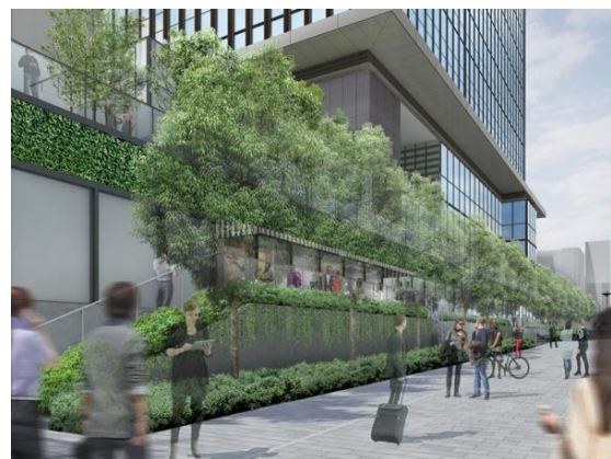
大門通り側の緑化軸を強化