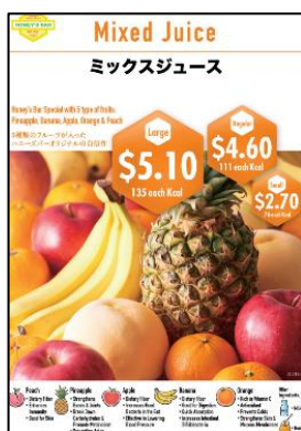
・ミックスジュース