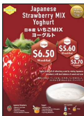
・日本産いちご MIX ヨーグルト