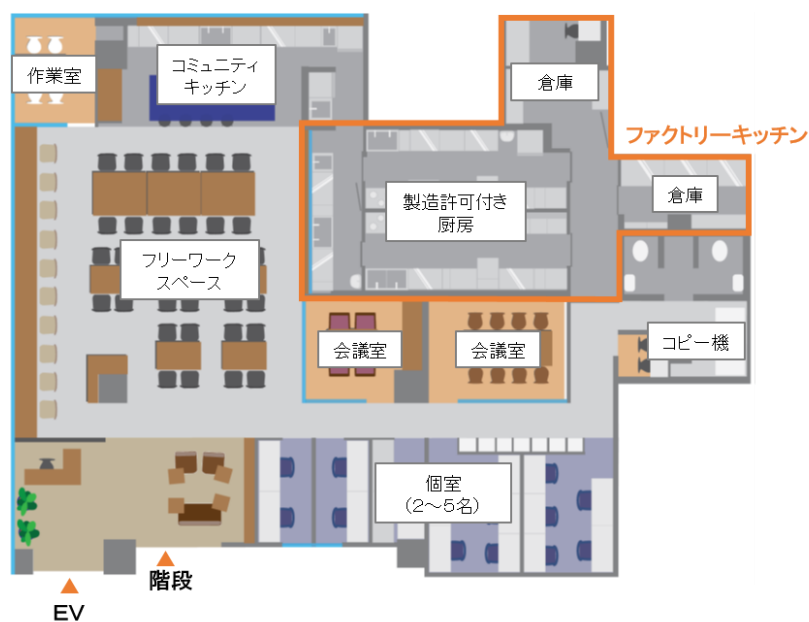
4階 コワーキングスペース・ファクトリーキッチン フloor図 (イメージ)