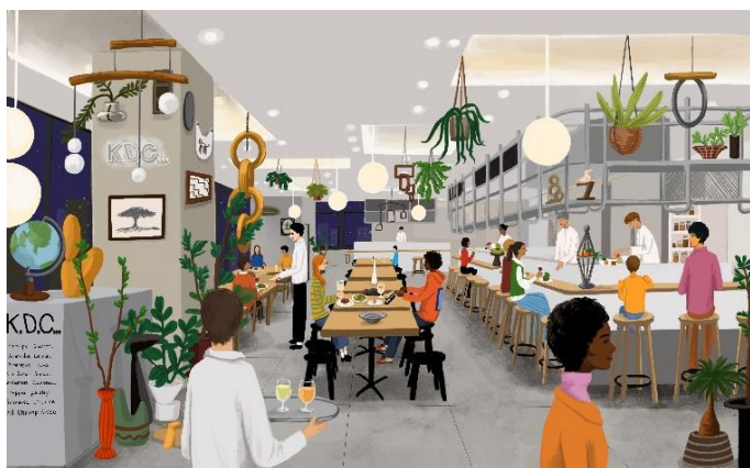
3階 シェアダイニング (イメージ)