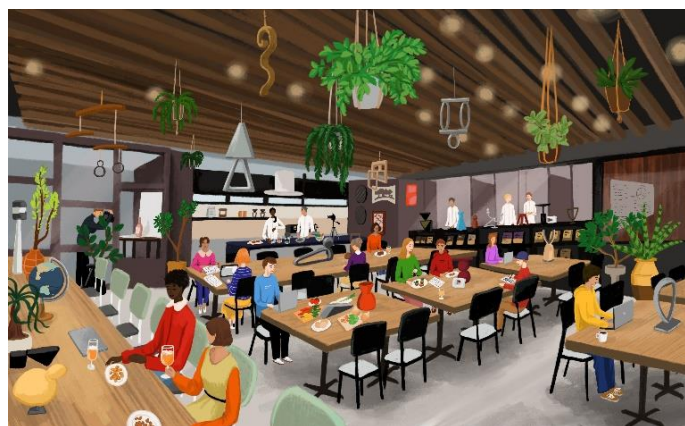
4階 コワーキングスペース・ファクトリーキッチン (イメージ)