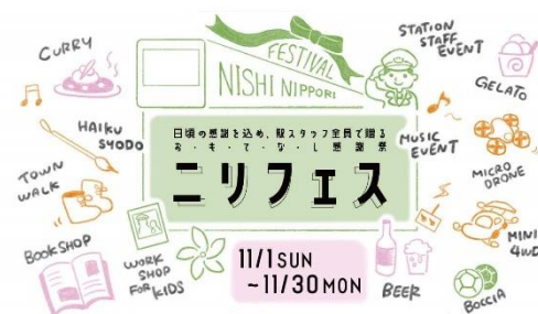
▲ニリフェスマインビジュアル

※新型コロナウイルスの感染状況により、一部の内容を変更または中止する可能性があります。