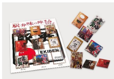
歴代駅弁大將軍マグネットセット