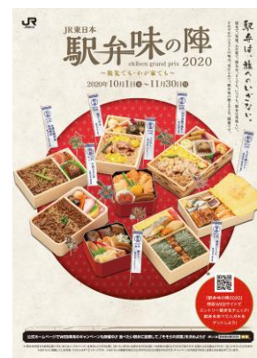
メインビジュアル