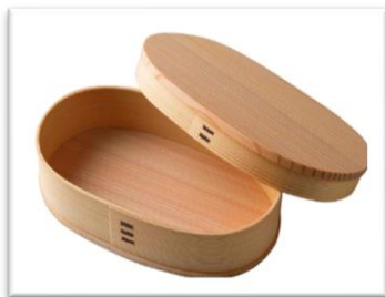
曲げわっぱ小判弁当（中）

*ヘッドマーク IC カードケースは 10 種よりアトランダムに 1 つお送りいたします。