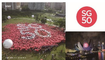
【BLACK代表作品】シンガポール建国50周年

「BLACK」公式ホームページ http://www.blackdesign.world