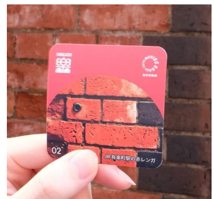
まち楽(ラク)ステッカー(イメージ)