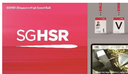
【Xinying代表作品①】Singapore High Speed Rail