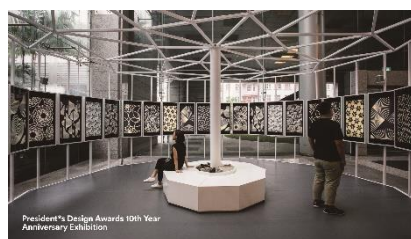
【Xinying代表作品③】シンガポールプレジデントデザインアワード