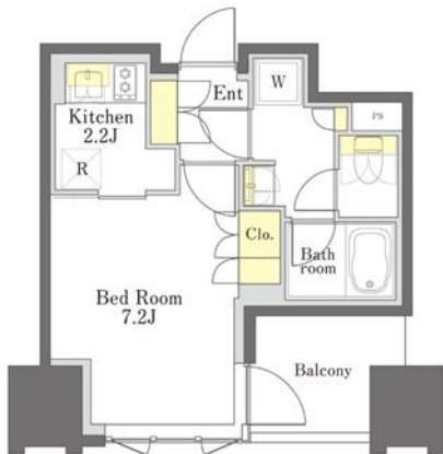
1K: 26.4 m 2 (D タイプ)

キッチン、バスルーム、トイレをそれぞれ独立させた機能的な単身者向けの間取りです。