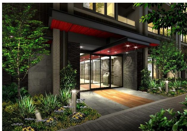
建物エントランス完成イメージ