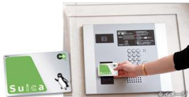
Suica 他交通系 IC カード入退室管理システムイメージ

※3 セントリックスは、東日本旅客鉄道株式会社、JR 東日本メカトロニクス株式会社、セントラル警備保障株式会社の共同開発したシステムです。