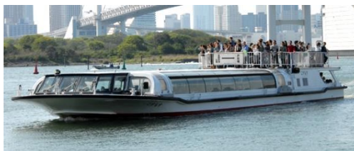
東京都公園協会「東京水辺ライン(こすもす等)」