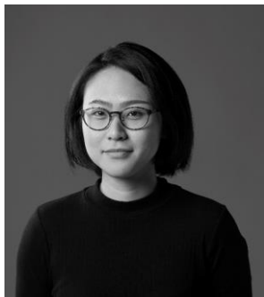
Xingying シンイン Singapore