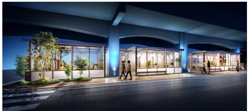
食堂/カフェテリア イメージ (L棟)