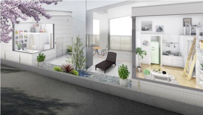
C 棟 (Studio タイプ) イメージ (設計：谷内田章夫氏)

本施設は、居室内設備の充実したプライベート性の高い Studio タイプの部屋(C 棟)と共用部を充実させプライベート空間は最小限の Share タイプの部屋(L棟、H棟)で構成されています。入居者全員が利用できる食堂を完備し、安全性、バランスのとれた食事といった学生寮に必要な機能はもちろんのこと、学生同士の交流のため、各タイプごとに趣向の異なる共用部を設けるとともに、地域との交流のためのホールを設置しています。