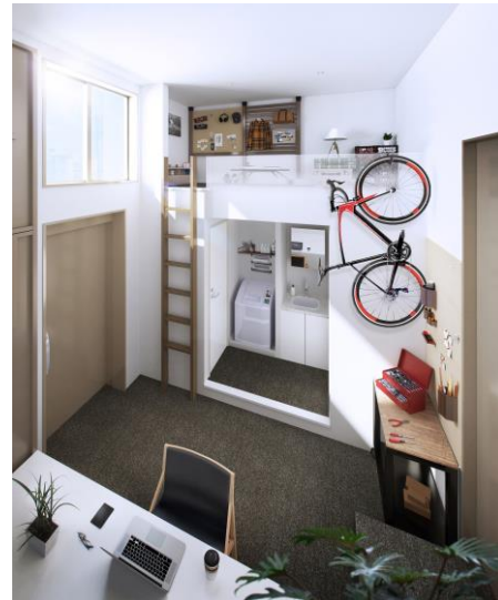
H 棟 (Share タイプ) 専用部イメージ (設計：木下道郎氏)