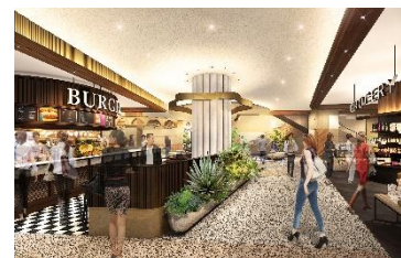
イメージパース アトレ内観

アート・ファッション・カルチャーに焦点をあてたラグジュアリーナイトクラブラウンジや五感を研ぎ澄ませ、自らの感性を高めることができる日本初のソーシャルエンターテインメント施設、水辺を臨む開放的なテラスで食事を楽しめる飲食店などが入居を予定しています。