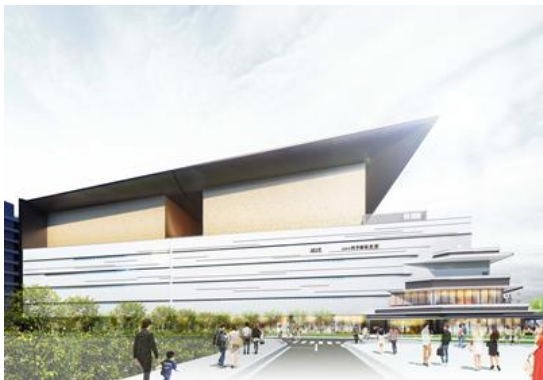
(イメージパース)シアター棟外観