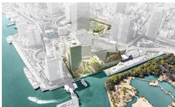
イメージパース(浜離宮恩賜庭園側外観)

団法人竹芝タウンデザイン」を設立しました。文化・芸術を核とした水辺を活かしたまちづくりの推進に、積極的に取り組んでいきます。