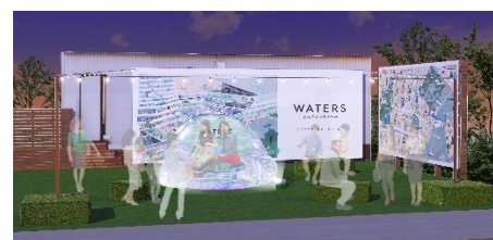
イベントイメージ

開催予定日 2019年9月12日(木)～9月15日(日) 開催時間 15時～23時 場所 The Farm Tokyo 内イベントスペース (東京都中央区八重洲2丁目1-1)