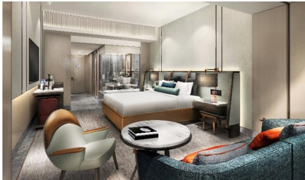
イメージパース(スタンダードルーム)

タワー棟の上層階に位置する「メズム東京」は、JR 東日本グループである日本ホテル(株)とマリオット・インターナショナルが初提携したラグジュアリーホテルです。グローバルレベルのサービスでお客様の五感を魅了し、世界中からのお客様をお迎えします。このたび、2020年4月27日(月)の開業決定を記念して、ダイニングクレジット付き開業記念宿泊プランを販売します。