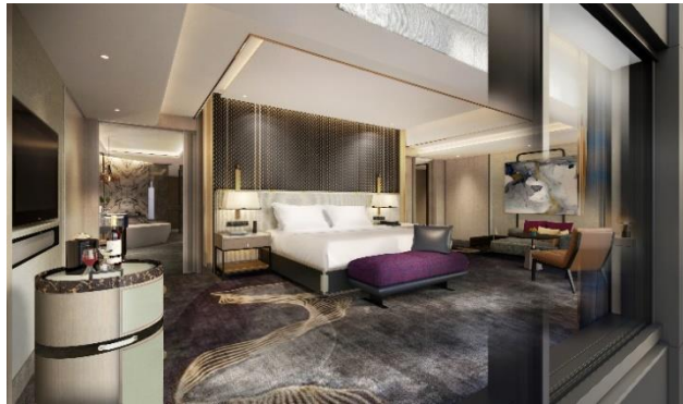
イメージパース(スイートルーム)