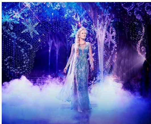
(参考)『アナと雪の女王』ブロードウェイ公演