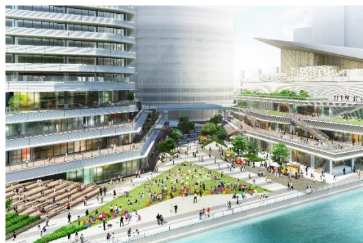
イメージパース(広場・テラス・水辺)