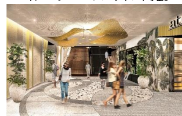
イメージパース アトレ内観