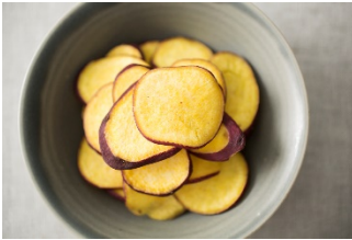
茨城のおいもちっぷす