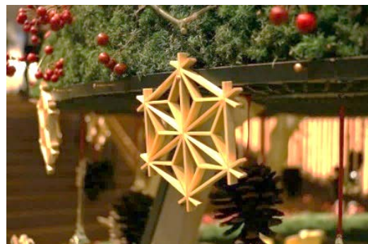
組木細工イメージ