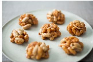
千葉のざくざくあらびー