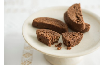
会津のチョコラスク