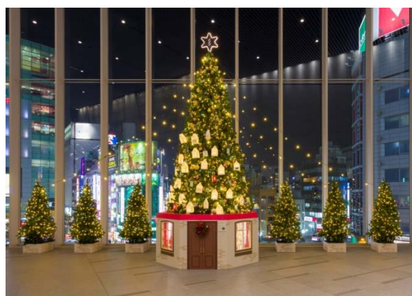
JR 新宿ミライナタワー