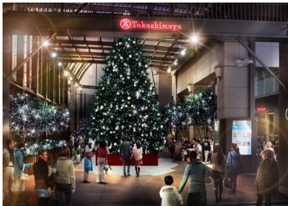
タカシマヤ タイムズスクエア