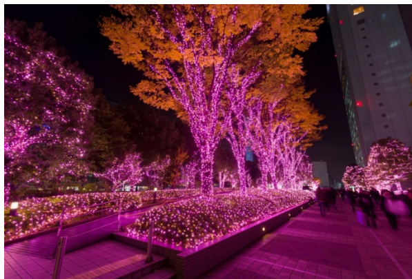
新宿サザンテラス