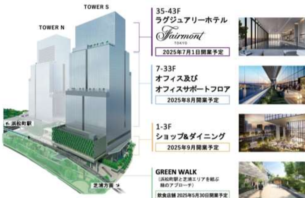
【図 1】各施設の開業スケジュール

各施設の情報下記、WEB サイトと SNS をご確認ください。今後、詳細な開業日や営業内容が確定次第、ニュースリリースや下記 WEB サイト等にて情報発信をまいります。