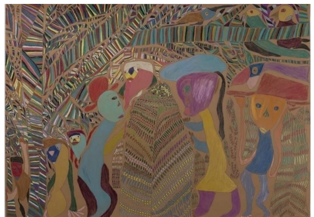
作品名：コーヒーを摘んでいる女の人