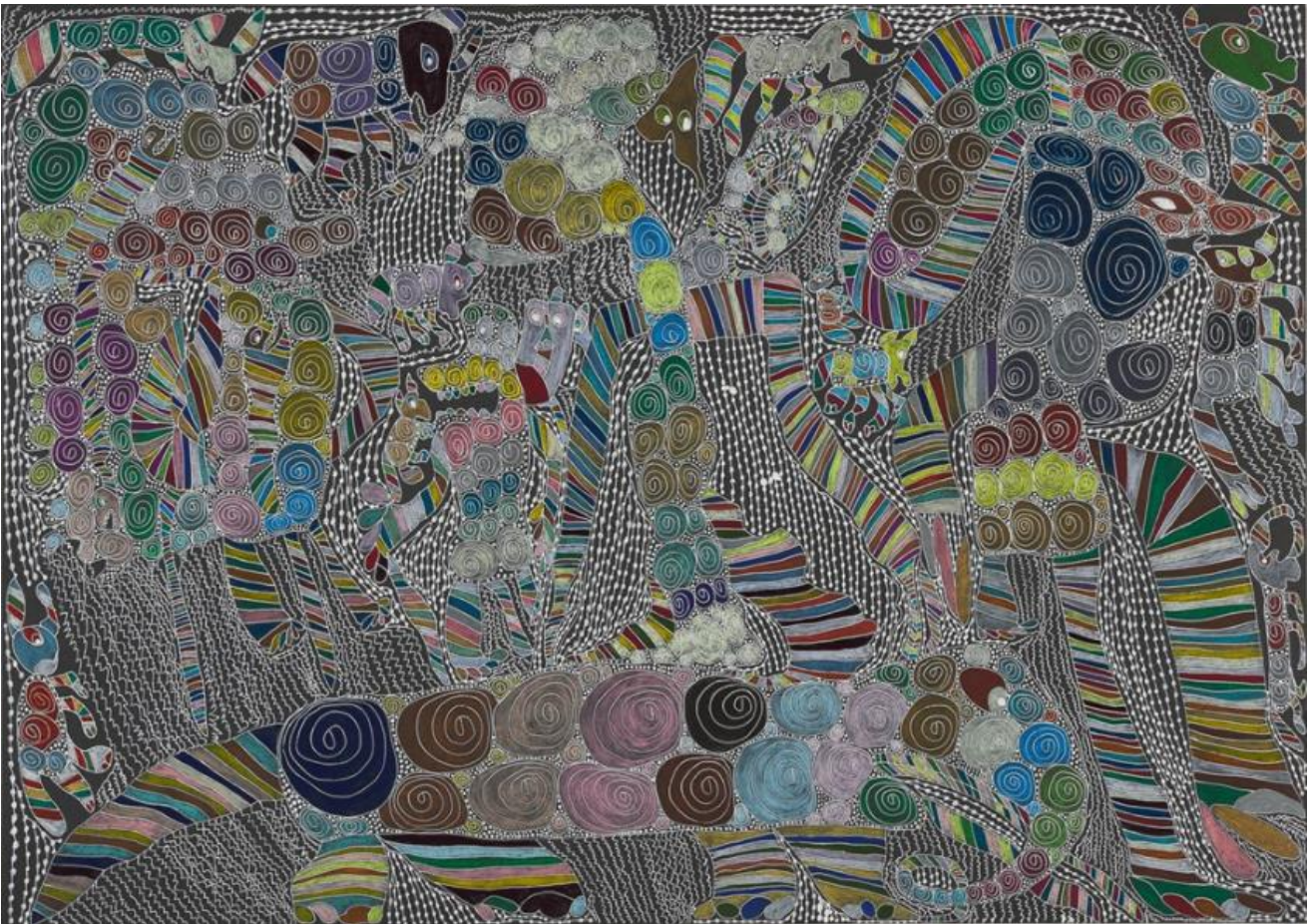
作品名：インドネシアの景絵（「JR 東日本賞」受賞作）