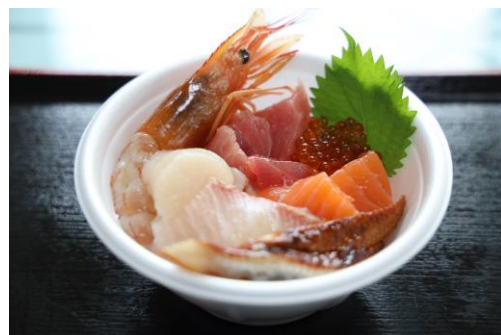
写真:海の幸 (イメージ)