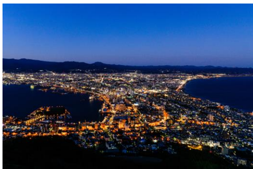
写真:函館山からの夜景