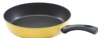
「イエローゴールド」