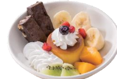
プリンアラモード 545円 (税込600円)

※写真はイメージです ※クリアファイル付きメニューはキャンペーン限定価格につき、通常と価格が異なります ※表示価格は「都市部」価格です。価格は店舗により異なります。詳しくはHPをご確認ください