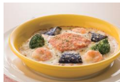
海老と明太子のドリア 864円 (税込950円)