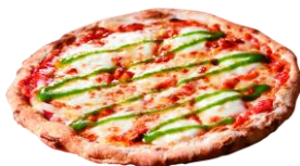
マルゲリータピザ 773円 (税込850円)