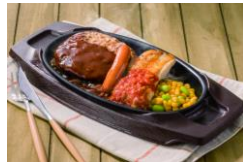
鉄板ハンバーグミックスグリル 818円 (税込900円)