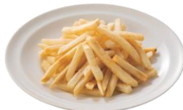
山盛りポテトフライ 500円 (税込550円)