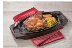
チキテキスパイス焼き 864円 (税込950円)