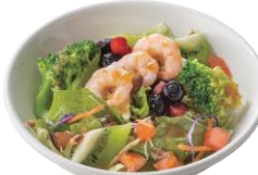
海老とフルーツのサラダS ＜1人前＞ 545円 (税込600円)