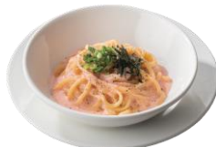
明太クリーム[ハーフ] 545円 (税込600円)