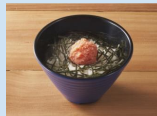
ちいさな明太子ごはん

※「ちいさなチーズピザ」「ちいさなマルゲリータ」は2023年10月26日～先行販売中