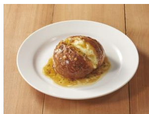
モッツアレラトースト バター醤油ソース 299円(税込329円)