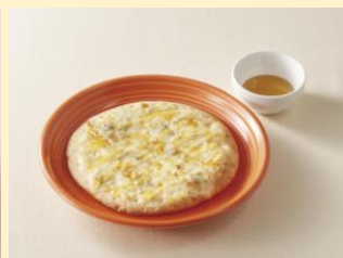
ちいさなチーズピザ (はちみつ付き)