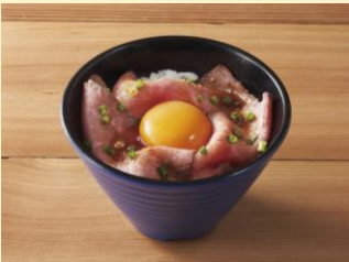
ちいさなローストビーフごはん