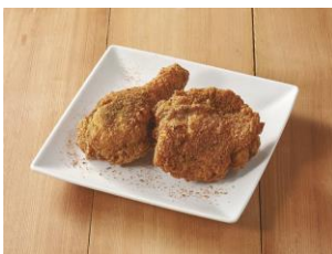
フライドチキン (ケイジャン) 2ピース 499円(税込549円)