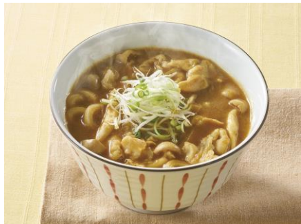
カレー南蛮うどん 799円（税込879円）

昔なつかしい、辛味をしっかりとつけたスパイシーでケセになる、洋食屋さんのカレーうどんです。