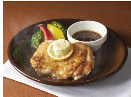
徳島県産 阿波尾鶏のステーキ※ 1,199円（税込1,319円）

ケセになる酸っぱさの熱々とろとろスープが自家製麺とよく絡みます。豚肉も入った大満足な一杯です。