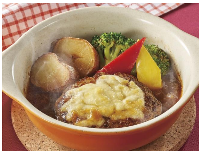
オニオングラタンハンバーグ 899円（税込989円）

ジョナサン自慢の国産オニオンを使用したオニオングラタンスープの熱々鍋風ハンバーグです。ハンバーグの肉汁と合わさって、食べ応え抜群です。