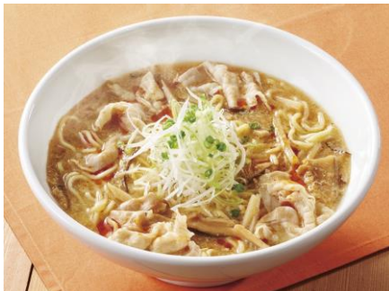
酸辣湯麺 799円（税込879円）

昔なつかしい、辛味をしっかりとつけたスパイシーでケセになる、洋食屋さんのカレーうどんです。