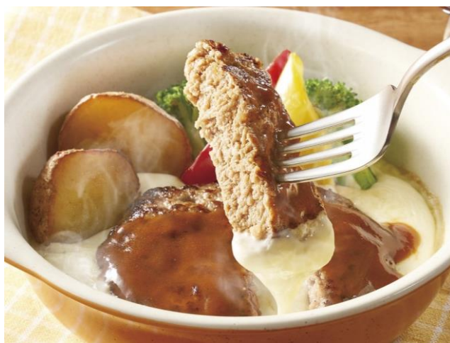
チーズフォンデュハンバーグ 999円（税込1,099円）

ジョナサン自慢の国産オニオンを使用したオニオングラタンスープの熱々鍋風ハンバーグです。ハンバーグの肉汁と合わさって、食べ応え抜群です。