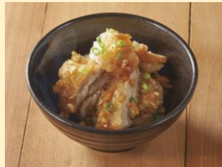
ちいさなおろし竜田チキン