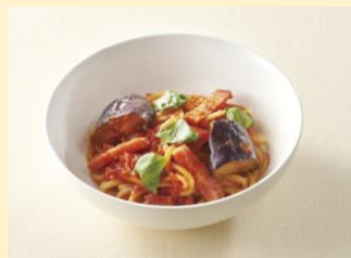
ちいさななすベーコンパスタ