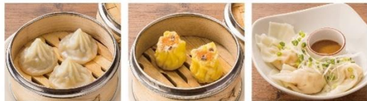
小籠包(3個) 海鮮焼売(2個) 皿海老雲吞(3個)