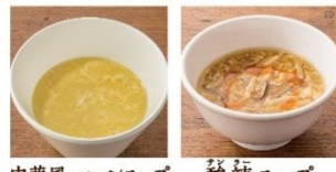
中華風 コーンスープ 酸辣スープ