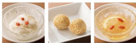
杏仁豆腐 ごま付きだんご(2個) オーギョーテ