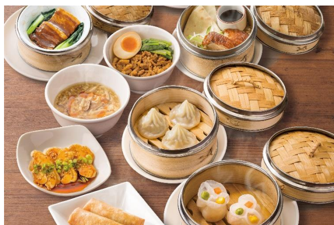
「桃菜」メニュー 一例