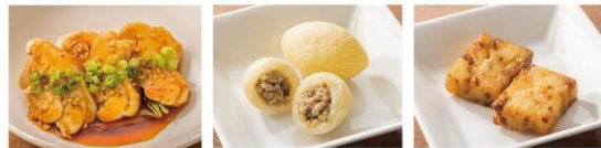
旨辛よだれ鶏 米粉揚げ餃子(咸水角 ハムスイコー)(2個) 大根餅(2個)