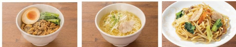
香肉飯(ルーハン) 鶏塩つゆそば(小) 炒麺(焼きそば)〈小〉